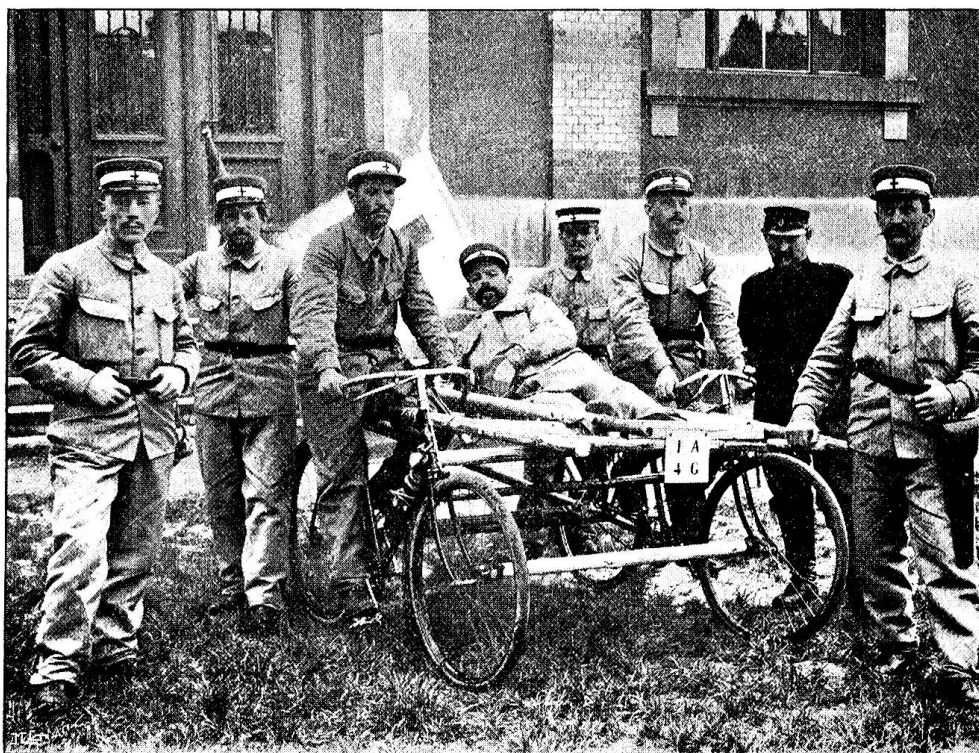
Brancard roulant improvisé, un brancard militaire supporté par deux bicyclettes. (La description détaillée en sera donnée dans le n° 3 de la Croix-Rouge suisse.)

Les malades doivent être enwagonnés le lendemain matin; à l'arrivée à Bâle ils seront transportés par voitures dans un hôpital d'urgence (la caserne) préparé pour les recevoir.