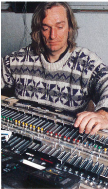
Der Schweizer Klangkünstler Andres Bosshard fühlt sich an seinem Mischpult wie ein Navigator auf hoher See. Für ihn ist die ganze Welt ein riesiges Klangmeer, noch völlig unbefahren und zu erforschen. «Meine eigenen Klänge sind ein Instrumentarium für diese Forschung.» Teile des Klangmeeres sind auch verkehrsreiche Plätze. Da wird ein Feuerwehrauto zum Sturm.