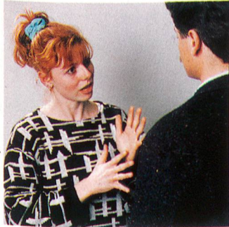
Gebärden statt Worte. Die Sprache der Gehörlosen emanzipiert sich – ein Gewinn auch für die Hörenden. Titelgeschichte. Seite 6