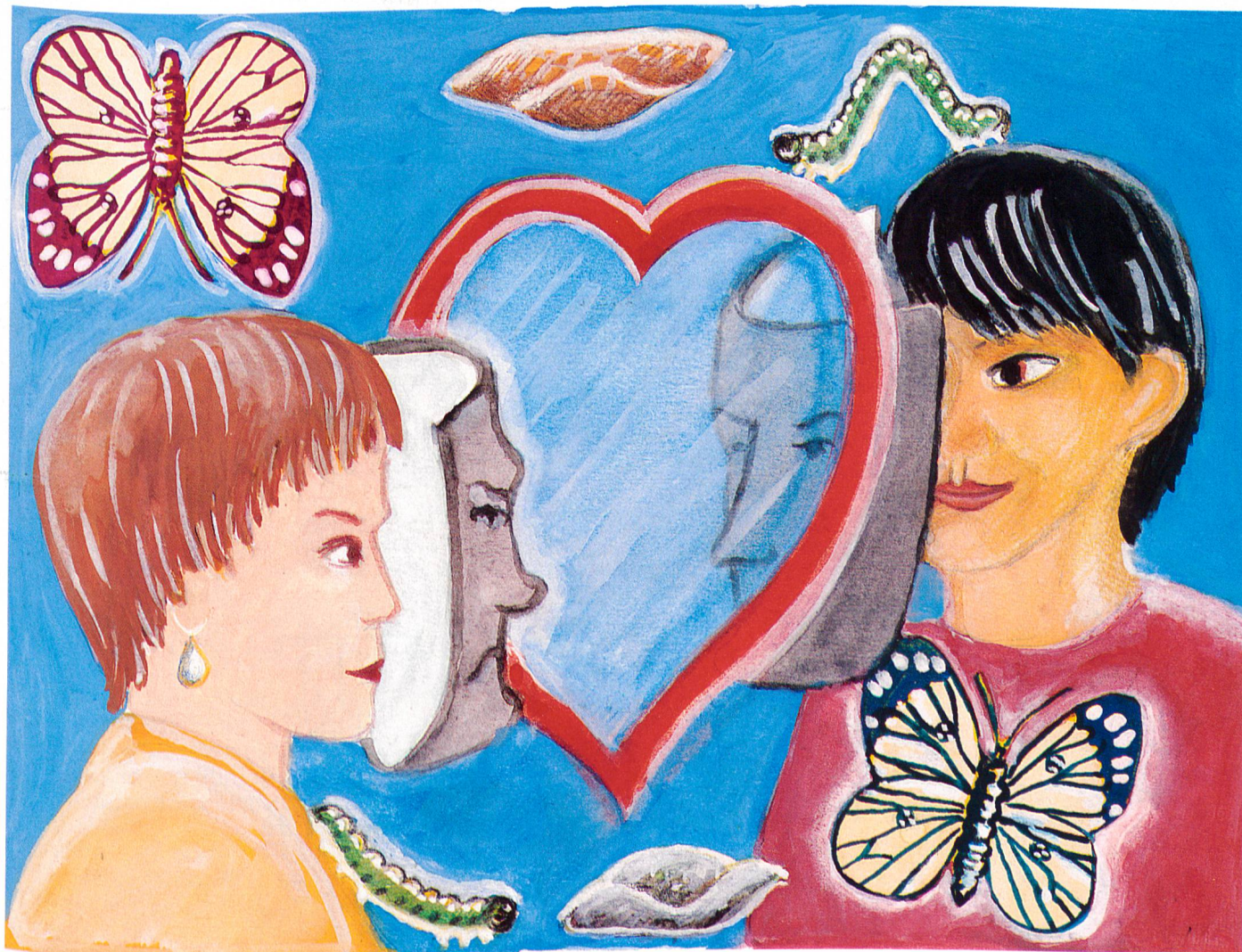
ILLUSTRATION: MARKUS STEINEGGER

Die Begegnung von fremden Menschen, die einander vom Schicksal «zugewiesen» werden, löst auf beiden Seiten einen Sturm von Gefühlen aus, die sich widersprechen. In der Begegnung der Schweizer Betreuerin und des Vietnamesen Trung stand dieser Gefühlssturm am Anfang einer Metamorphose.