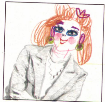
In uns allen lebt noch das Kind, das wir einmal waren. Ihm können Sie begegnen in den Übungen auf den Seiten 9/10 und im Test «Wie kindlich sind Sie?» auf Seite 41.

Bibliographie von Martin Speich LUST AUF MEHR LEKTÜRE? S. 50