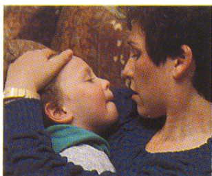
Die dramatische Geschichte des kleinen Micky. Seite 46.