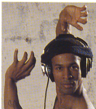
Ein Tänzer im Training. Er lauscht dem «Klang des Lebens». Titelgeschichte. Seite 6.