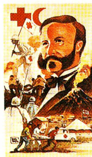
125 AÑOS CRUZ ROJA Y MEDIA LUNA ROJA PRIMER DIA DE EMISION : 10 DE MAYO DE 1988

halbmondgesellschaften 1969 ihr 50jähriges Bestehen feierte, wurden in 24 Ländern 67 Postwertzeichen in Umlauf gebracht. Aus Anlass des 150. Geburtstages von Henry Dunant 1978 schliesslich wurden in 7 Ländern 11 Briefmarken ausgegeben. Dazu zählte auch die Schweiz, die Dunant schon 50 Jahre zuvor mit einer Briefmarke geehrt hatte, und zwar der ersten, die das Porträt des Rotkreuzgründers trug.