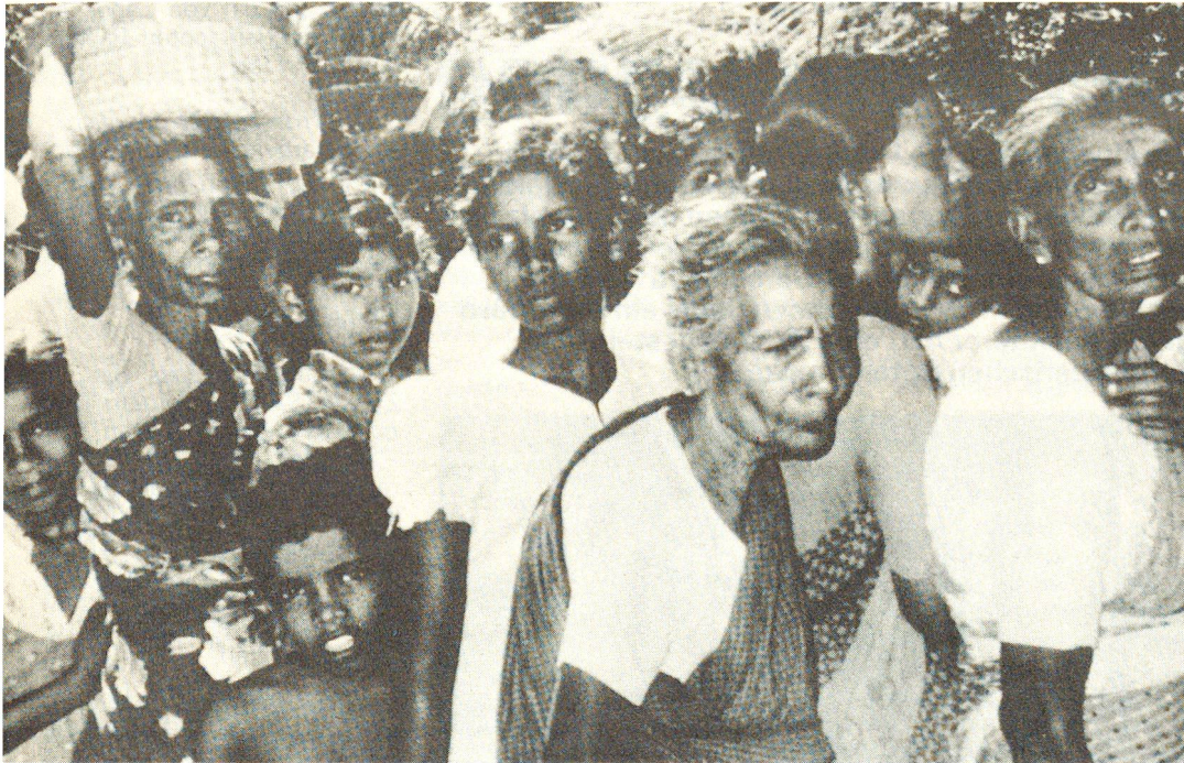
Unter kriegesischen Auseinandersetzungen leidet immer auch die Zivilbevölkerung: Tamilische Frauen stehen im Sommer 1987 bei Jaffna für Mehl und Reis an, die von der indischen Regierung geliefert wurden, nachdem die Kämpfe zwischen separatistischen Tamilen und Regierungstruppen zu Versorgungsschwierigkeiten und Hungersnot geführt haben.