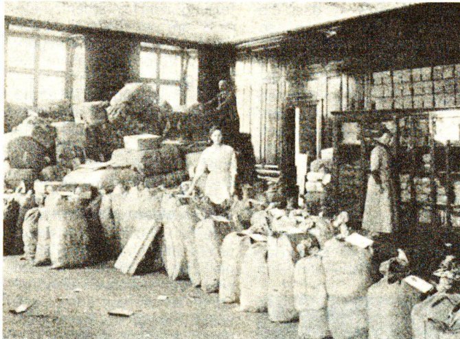
Im Zentraldepot: die tägliche Spedition ist versandbereit.

Zur Aufnahme der Naturalspenden richteten die SRK-Sektionen und die Samaritervereine regionale Sammelstellen ein. Später mussten angesichts des grossen Spendenzuflusses in St.Gallen, Zürich, Luzern, Lausanne und Bern fünf grosse Zentraldepots eröffnet werden. Ab März 1916 bis zum Ende der Mobilisation blieb dann allerdings nur noch das direkt dem Rotkreuz-Chefamt unterstellte Berner Depot in Betrieb. Erwähnenswert ist in diesem Zusammenhang die Tatsache, dass die Eidgenössische Postdirektion für die meisten Sammelplakate Portofreiheit gewährte, was wesentlich zum Erfolg der Kollekte beitrug.