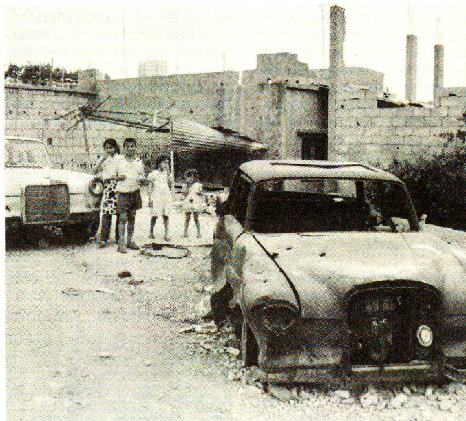
Einst ein blühendes Land, leidet Libanon heute nicht nur unter dem Krieg, sondern auch unter einer schweren Wirtschaftskrise.

der ASS ist durch einen Vertrag geregelt. Das SRK und der Bund tragen die Kosten für das eingeführte Material, die zu Ausbildungszwecken benötigten Apparate und das Gehalt des Instructors. Das SRK verfügt auch über einen kleinen Sozialfonds für Patienten, die nicht von der Regierung unterstützt werden, also mehrheitlich Nicht-Libanesen. Die Patienten bezahlen in der Regel 20% der Kosten, der Rest wird ihnen vom libanesischen Gesundheitsministerium zu-