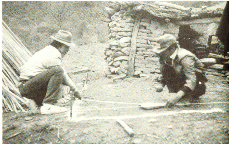
Unter Anleitung und mit lokalen Materialien werden erste Schritte zur Sanierung der Wohnstätten unternommen.

Und die Bekämpfung der Vinchucas? An einem Seminar in Redención Pampa vom vergangenen März, das sich neben vielen anderen Themen