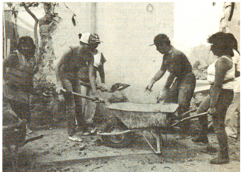
Ein Fachmann zeigt, wie's gemacht wird. Die Frauen packen kräftig an.

Auch die Vereinigung «Cam-pamentos Unidos AC», mit der das SRK eng zusammenarbeitet, hat eine Finanzkommission (Fortsetzung Seite 22)