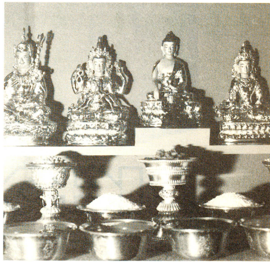
In fast jedem Tibeter Haushalt steht ein Hausaltar. In der Mitte ein Buddha, links und rechts davon Göttinnen der Weisheit, der Barmherzigkeit, des langen Lebens usw. Vorne Opferschalen mit Getreide und klarem Wasser.

Wie lange werden die Tibeterflüchtlinge die alten Familientraditionen im Ausland bewahren können? Der kleine Tenzin Dhamdün wird eines Tages die Schweizer Schulen besuchen und mit den andern Kindern zürichdeutsch sprechen. Wird er je ganz verstehen, welche religiösen Kunstwerke sein Vater in der Freizeit schafft und welche uralte my-stische Bedeutung sie haben? □