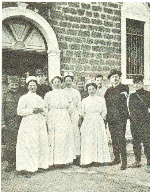
Angehörige der Schweizer Mission vor dem Spital in Durazzo im Frühjahr 1913.