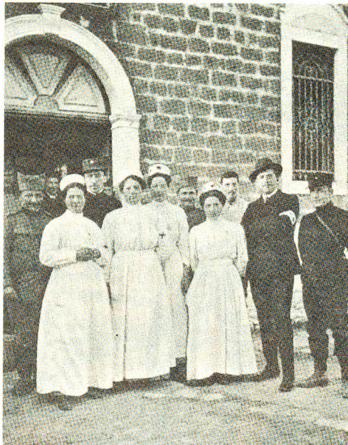
Angehörige der Schweizer Mission vor dem Spital in Durazzo im Frühjahr 1913.