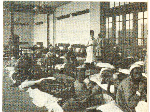
Im Spital der Schweizer Kolonie in Konstantinopel. Das SRK stellte der Kolonie Geld und Material zur Verfügung.