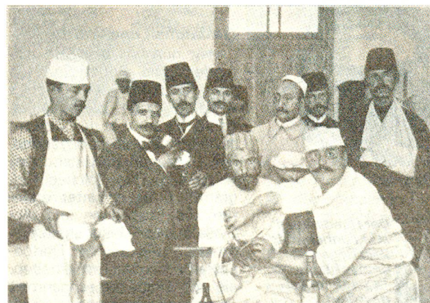
Eingriff im «Schweizer Spital von Konstantinopel». Hier wurden Hunderte von Verwundeten und Kranken gepflegt.

dorthin entsandt wurde. Ganz im Gegenteil, es trug in Zusammenarbeit mit der Schweizer Kolonie von Konstantinopel durch seine Geldspenden (20000 Franken), Kleider- und Nahrungsmittelsendungen (Kondensmilch) dazu bei, «viel Not im Lager des osmanischen Heeres zu lindern». Das «Schweizer Spital von Konstantinopel», unter der Leitung eines ehemaligen türkischen