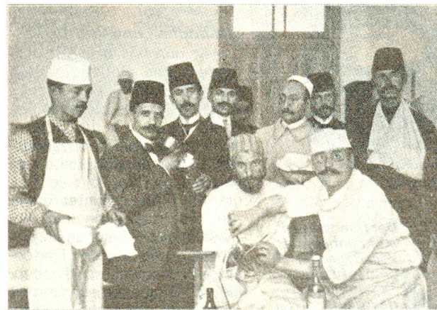
Eingriff im «Schweizer Spital von Konstantinopel». Hier wurden Hunderte von Verwundeten und Kranken gepflegt.

dorthin entsandt wurde. Ganz im Gegenteil, es trug in Zusammenarbeit mit der Schweizer Kolonie von Konstantinopel durch seine Geldspenden (20000 Franken), Kleider- und Nahrungsmittelsendungen (Kondensmilch) dazu bei, «viel Not im Lager des osmanischen Heeres zu lindern». Das «Schweizer Spital von Konstantinopel», unter der Leitung eines ehemaligen türkischen