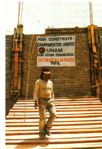
Reihen-Einfamilienhäuser in Ciudad Guzman; sie wurden mit wenigen Ausnahmen an der selben Stelle neu gebaut.

Hier bauen: «Campamentos Unidos», UNAM, mit der finanziellen Hilfe des Schweizerischen Roten Kreuzes, FIFA, signalisiert die Anschrift auf einer Baustelle in Mexico D.F.