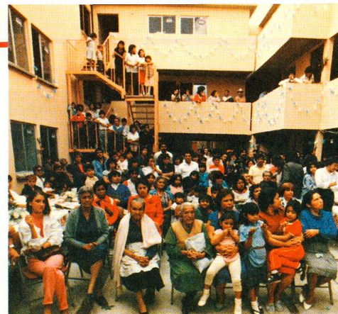
Nach getaner Arbeit wird gefeiert. In Mexico D.F. werden in diesen Wochen zahlreiche vom SRK finanzierte «Vecindades» eingeweiht.

Durch diese Vorgehensweise liessen sich zum Teil sehr günstige Preise erzielen. So kam der niedrigste Quadratmeterpreis in Mexico D.F. auf 63 – 70 US-Dollar zu stehen. Etwas höhere Preise bewegten sich zwischen 78 – 95 und 103 – 108 Dollar. Als Vergleich: Das staatliche Wiederaufbauprogramm – der mexikanische Staat hat (in Rekordzeit) 44 000 Wohnungen gebaut – rechnet mit Quadratmeterpreisen von 250 – 280 Dollar. Die staatlichen Wohnungen belasten ihre Bewohner denn auch mit einer Miete, die 30% des Mindestlohnes ausmacht, was enorm viel ist, wenn man bedenkt, dass für Einkommensschwache die Mieten in Mexi-