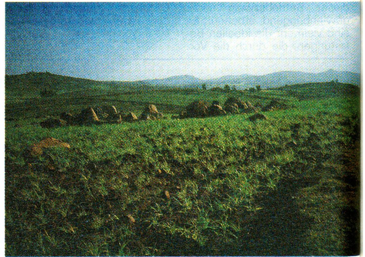
August 1985: Überall grünte es – doch zum Anpflanzen fehlten sämtliche Mittel.

hilfeaktionen des Internationalen Komitees vom Roten Kreuz (IKRK) in den Konfliktzonen Äthiopiens und die Hilfsprogramme des Äthiopischen Roten Kreuzes in den Dürregebieten unterstützt, ist indessen überzeugt, dass die Entwicklung in diesem Land weiterhin verfolgt werden muss. Noch ist die Not der äthiopischen Bauern und Nomaden nicht beseitigt. Pessimisten schliessen eine neue Katastro-