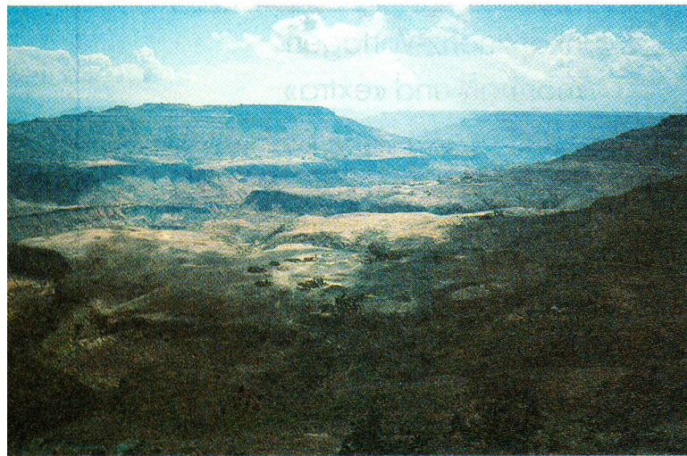
Der Tegulet-and-Bulga-Distrikt am Abbruch des abessinischen Hochlandes. In den tiefen Tälern liegen verloren Streusiedlungen.