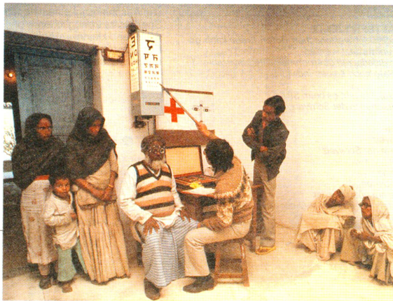
Blick in den Konsultationsraum des Spitals von Nepalganj.