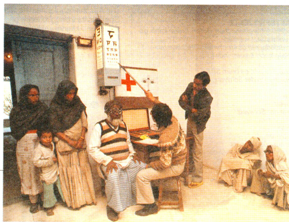
Blick in den Konsultationsraum des Spitals von Nepalganj.

insbesondere bei Kindern – eine frühzeitige Erblindung verhindert werden. Die Weltgesundheitsorganisation (WHO) hat deshalb schon Anfang der achtziger Jahre zusammen mit den nepalesischen Behörden ein umfassendes Programm zur Bekämpfung und Verhütung der Blindheit eingeleitet. Es erstreckt sich auf alle 14 Zonen des Landes und wird von der Hauptstadt Katmandu aus