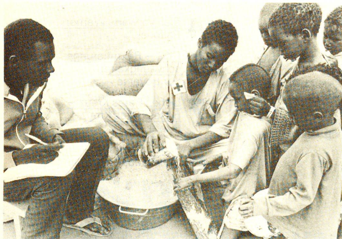
Die Abteilung Auslandhilfe (neu: Internationale Zusammenarbeit) des Schweizerischen Roten Kreuzes hat als Attraktion Nomaden- und Flüchtlingszelte aus ihren Einsätzen mitgebracht. Die Delegierten stehen für jede Diskussion zur Verfügung.

Im Zeichen des Roten Kreuzes: RETTEN, HELFEN, AUSBILDEN