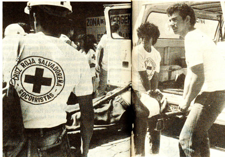
El Salvador In El Salvador hat das SRK vorerst Hilfsgüter zur Überbrückung der akuten Notlage eingesetzt. Projekte des Wiederaufbaues und der sozialen Rehabilitation werden ausgearbeitet.

Mexiko Das SRK unterstützt den Wiederaufbau von «Vecindades», Gemeinschaftsgebäuden in Mexiko-Stadt. Die zukünftigen Bewohner, meist mehrere Dutzend Familien, haben sich organisiert und beteiligen sich aktiv an den Entscheidungen und an den Bauarbeiten.