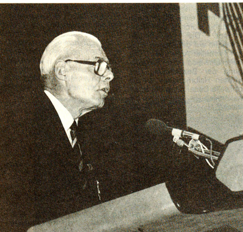
Kurt Bolliger, während seiner Eröffnungsansprache an der XXV. Internationalen Rotkreuzkonferenz in Genf. «Ich glaube in dieser Lage meine Pflicht getan zu haben.»

Reihe wichtiger Resolutionen sind geeignet, der Rotkreuzarbeit weltweit neue, wirkungsvolle Impulse zu verleihen. Sie teilen indessen die Auffassung, dass die Rolle und Arbeitsweise der Rotkreuzkonferenzen, der obersten beratenden Instanz der Internationalen Rotkreuz- und Rothalbmondbewegung, wie auch das – notwendige – Zusammenwirken zwischen Rotem Kreuz und Regierungen einer vertieften Prüfung zu unterziehen sind. □