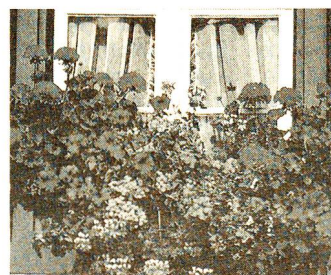
Balkon im Sommer.