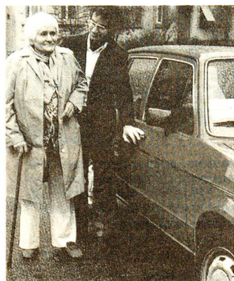
Autodienst (1500 000 km wurden 1985 freiwillig im Dienst des Mitmenschen gefahren).