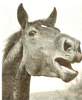
Die Hengste im Haras fédéral haben legendäre Stammbäume.