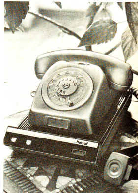
Das Ericare Sicherheitstelefonssystem funktioniert über das normale Telefonnetz der PTT und deckt so mit die ganze Schweiz ab.

Mit einem Druck auf die Notruf-Taste kann der Hilfesuchende von überall in seiner Wohnung die Notrufzentrale alarmieren