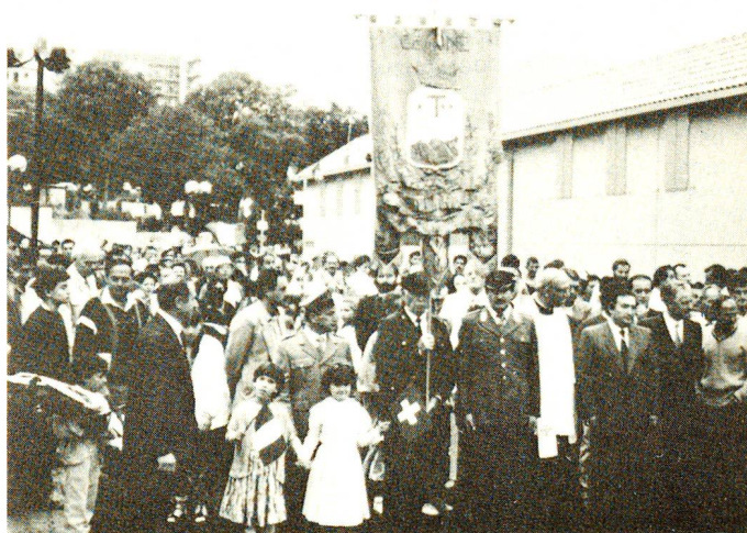
Die Einweihung der Wohnsiedlung weitete sich zu einem regelrechten Volksfest aus.

Insgesamt hatte das Erdbeben vom 23. November 1980 3000 Tote, 8000 Verletzte und über 300 000 Obdachlose gefordert. Für die Nothilfe sowie für den Wiederaufbau hat das SRK bisher über 10 Mio. Franken eingesetzt. □