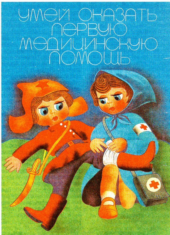
Erste-Hilfe-Kurse sind im ganzen Land sehr beliebt.

Die Rolle der beiden Supermächte UdSSR und USA in der internationalen Rotkreuz-Szene lässt sich in nichts mit jener vergleichen, die sie in der UNO spielen. Sie sind im Zeichen des Roten Halbmondes