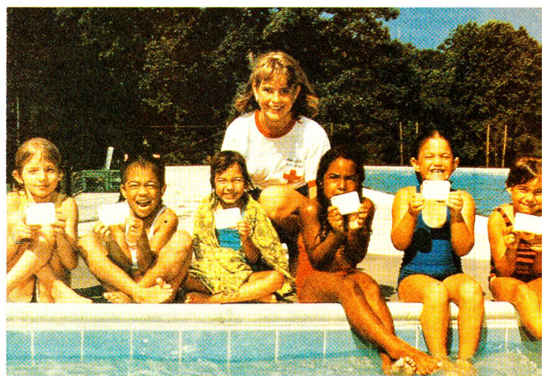
«Fun» wird vor allem in den Bevölkerungskursen grossgeschrieben. Zum Kursprogramm gehört auch die Ausbildung im Schwimmen.