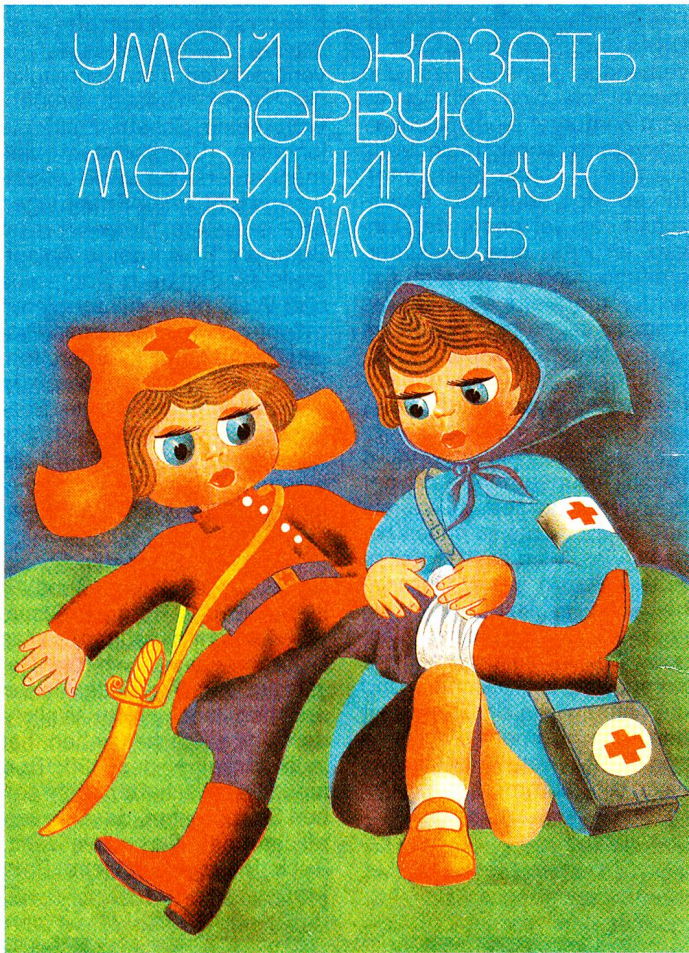
Erste-Hilfe-Kurse sind im ganzen Land sehr beliebt.

Die Rolle der beiden Supermächte UdSSR und USA in der internationalen Rotkreuz-Szene lässt sich in nichts mit jener vergleichen, die sie in der UNO spielen. Sie sind im Zeichen des Roten Halbmondes