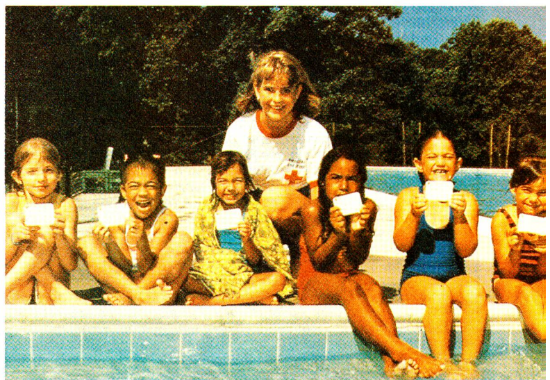
«Fun» wird vor allem in den Bevölkerungskursen grossgeschrieben. Zum Kursprogramm gehört auch die Ausbildung im Schwimmen.