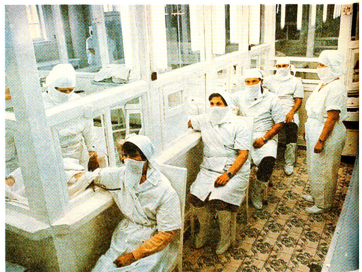
Blutspenden wird in der UdSSR als Bürgerpflicht erachtet.