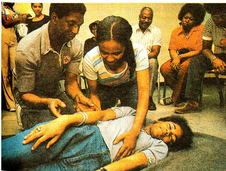
Erste-Hilfe-Kurse auch in den USA.