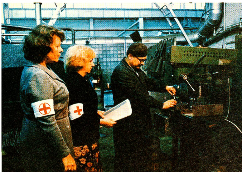
«Saniposti» (Samariterposten) des Roten Halbmondes der Sowjetunion finden sich überall.

Aber keine andere nationale Rothalbmond- oder Rotkreuzgesellschaft hat den «Frieden» derart energisch als Hauptanliegen auf ihren Schild gehoben wie die Russen. Für die einen mag das nach Manipulation riechen. Sicher aber ist, dass es das russische Volk, genau wie alle anderen Völker der Erde, mit seiner Sehnsucht nach Weltfrieden ehrlich meint. □