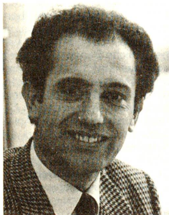
Bénédict von Tscharnier (1937), Schweizer

Doktor der Rechte. Berufsdiplomat im Rang eines Schweizer Botschafters. Verheiratet, Vater von zwei Kindern.