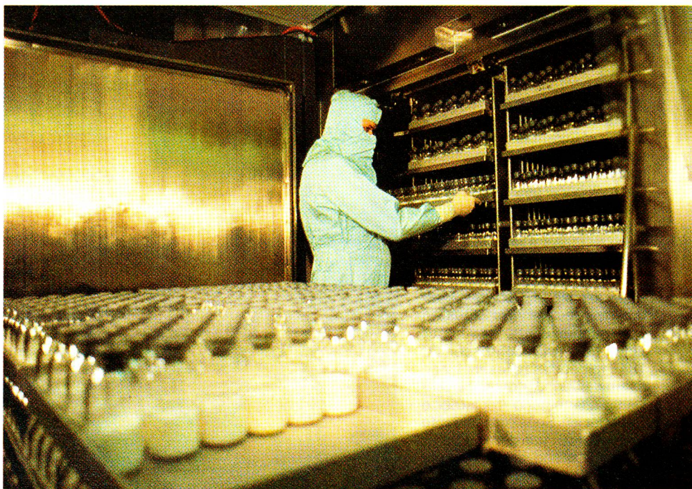
Das Zentrallaboratorium in der Nähe des Wankdorfes in Bern ist rund 500 Angestellten ein sozial fortschrittlicher Arbeitgeber. Als Non-Profit-Organisation wird in erster Linie bei allfälligen Überschüssen in die Forschung investiert.

In neuester Zeit rückt Sandoglobulin sogar bei der Behandlung von AIDS in den Mittelpunkt des Interesses. □