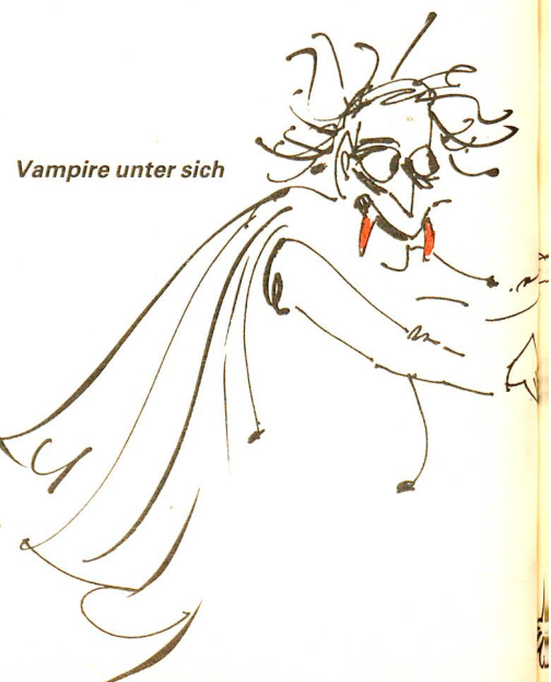
Vampire unter sich