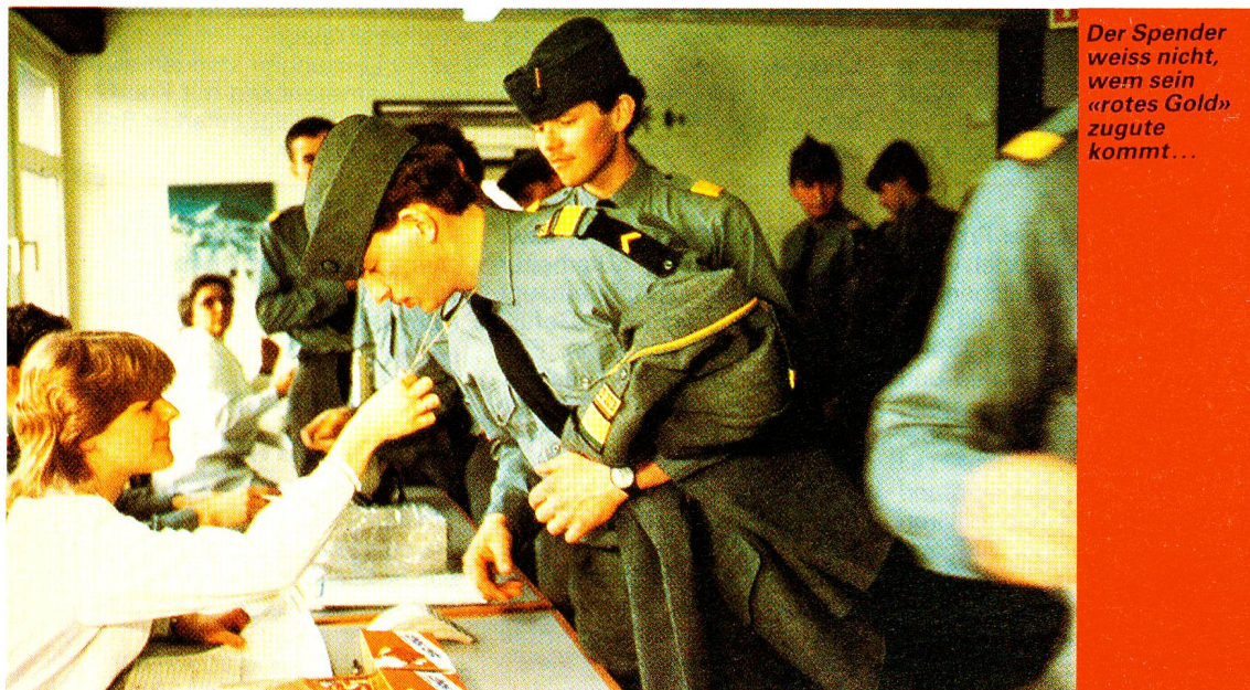
Der Spender weiss nicht, wem sein «rotes Gold» zugute kommt...

Ein hämogenetischer Vaterschaftsnachweis beruht darauf, dass ein Kind ein vererbtes Blutmerkmal besitzt, das in bestimmten Menschengruppen vorhanden, aber weder bei der Mutter noch beim vermuteten Vater nachweisbar ist. Nur der richtige Vater