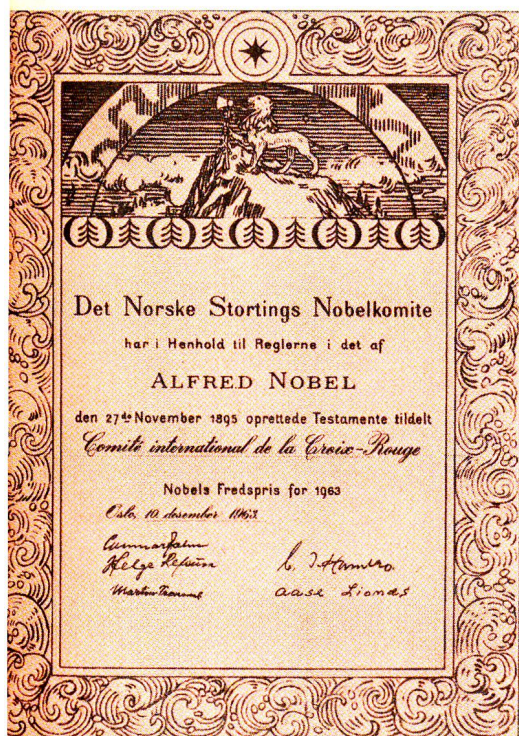
1963: Friedensnobelpreis für das Internationale Komitee vom Roten Kreuz.