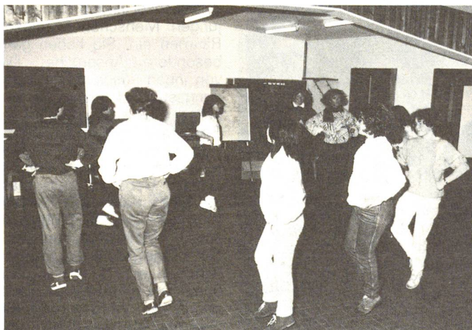
Sichkennenlernen bei Tanz und Rollenspielen.

derhalb Tage dauerte, erlebten Jugendliche zum Beispiel Krisensituationen, wie sie zum Alltag des Roten Kreuzes gehören. Dabei wurden die Jugendlichen in Gruppen, analog der Organisation des Roten Kreuzes, aufgeteilt und hatten nun konkrete Fälle zu bewältigen, wie beispielsweise Erdbeben in der Türkei, Unwetter in der Schweiz, Hungernde in 20 Ländern Afrikas.