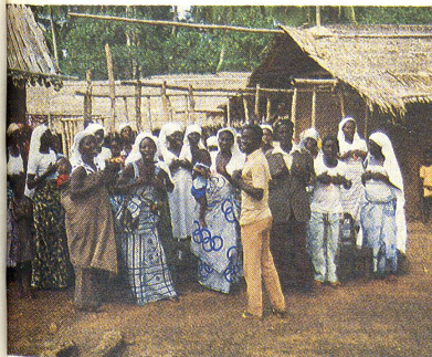
Der Club der Mütter des lokalen Roten Kreuzes sorgt in den Dörfern (der Western Region) für hygienische Verhältnisse und gesunde Ernährung der Kinder. Und wenn die Männer sich nicht an die Regeln halten, müssen sie zur Strafe 2 Tage Frondienst für die Gemeinschaft leisten.

Dass es sich bei dieser Zusammenarbeit durchaus nicht nur um eine administrative Reorganisationsübung am «grünen Tisch» handelt, zeigen die verschiedenen Projekte im Bereiche der Basisgesundheitsversorgung, die bereits begonnen wurden oder die sich Ghana Red Cross für die nächsten Monate und Jahre vorgenommen hat. Unterstützung lokaler Initiativen zur Verbesserung der hygienischen Verhältnisse in den Dörfern, Verbesserung der Ernährungslage, Sanierung der Trinkwasserversorgung sowie der Aufbau und die Führung von einfachen Dorfkliniken – alles unter der Überwachung des fachkundigen Personals von Ghana Red Cross und der Delegierten – gehören in den Rahmen dieser Projekte. Hier braucht es punktuell die Unterstützung von aussen, und das SRK hat der ghanaischen Gesellschaft diesen Beistand zugesichert. Und hierfür werden auch die dem SRK noch verbleibenden Mittel aus der Sammlung für die Rückkehrer aus Nigeria eingesetzt. Auch die Jugend Gha-