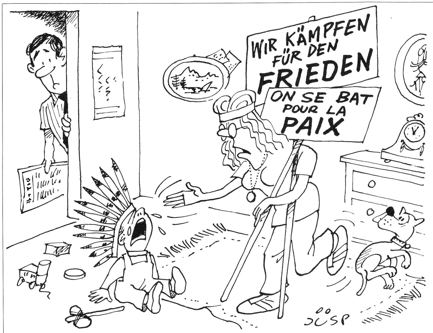
Konfliktbewältigung im Alltag... L'art de surmonter les conflits...