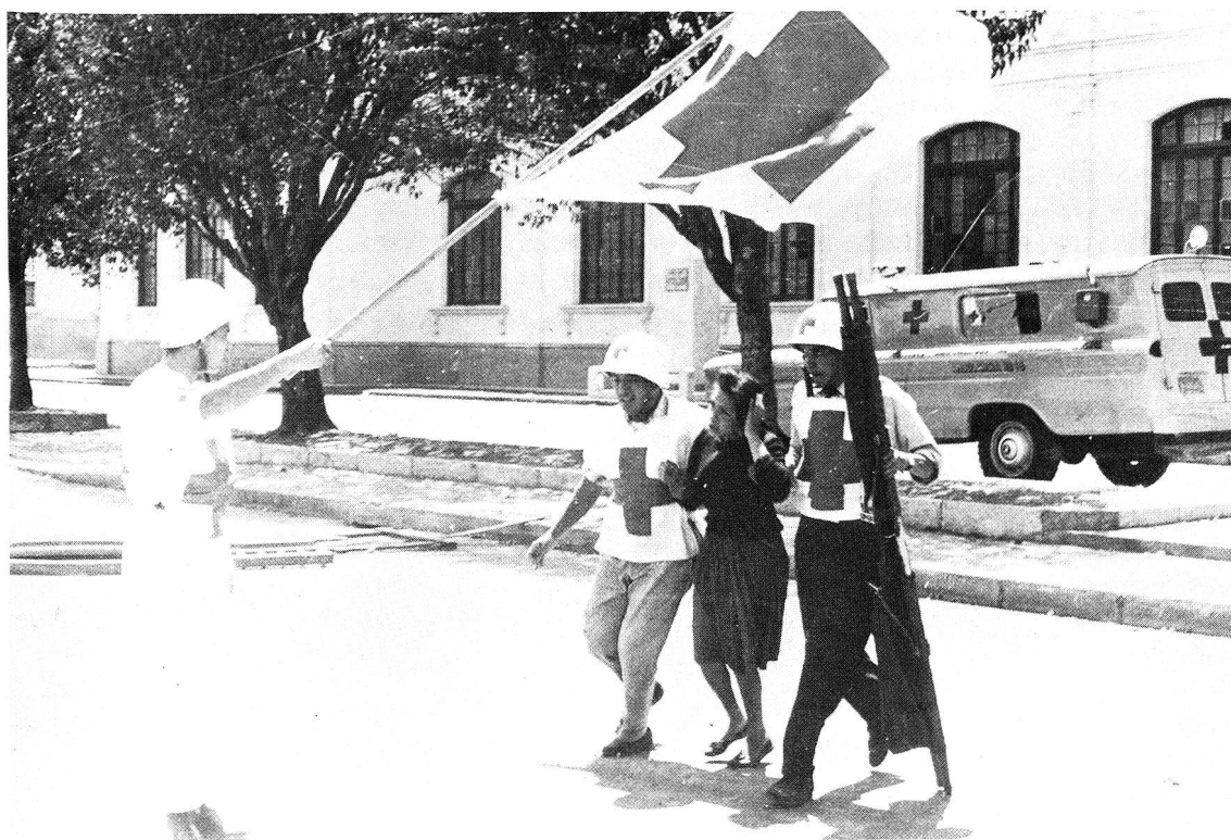
Unter dem Schutz der Rotkreuzfahne werden Zivilisten aus dem besetzten Regierungsgebäude von Managua herausgeführt.