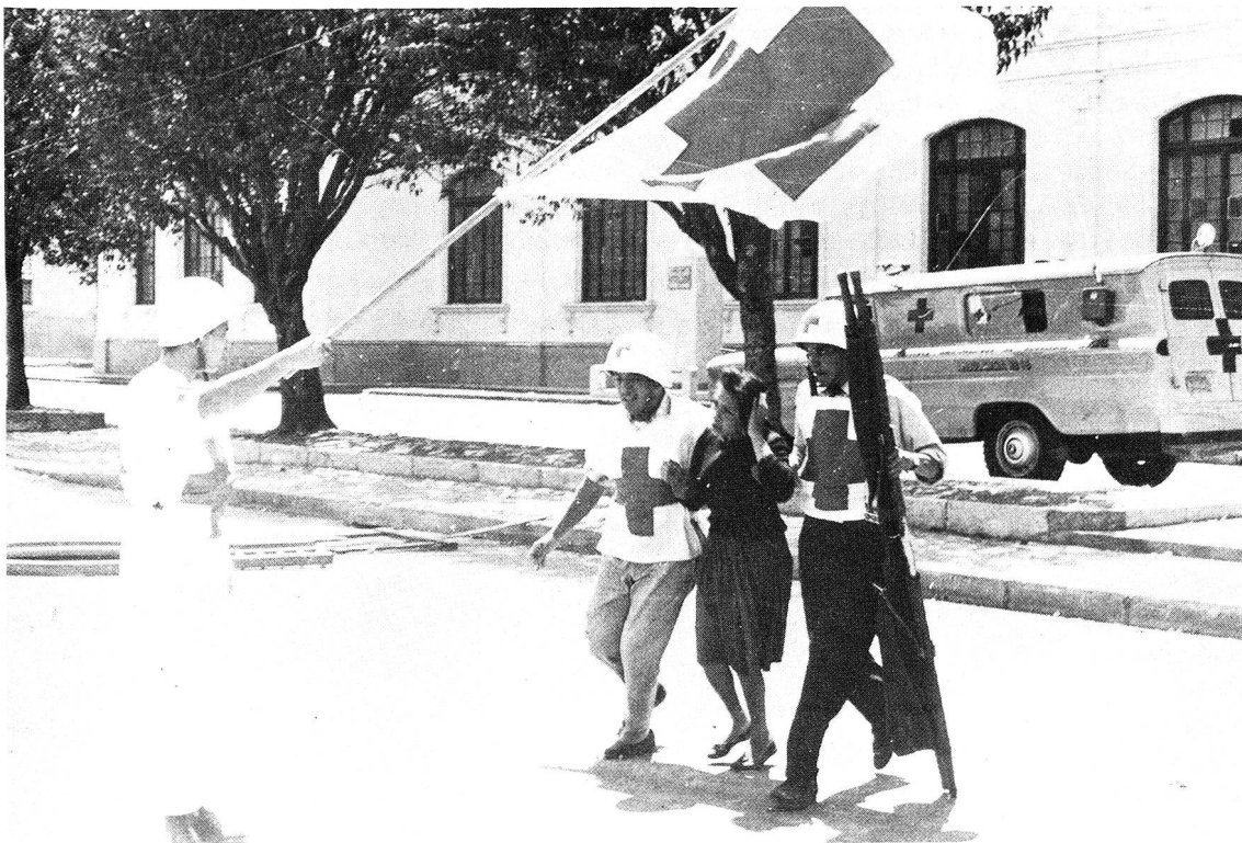
Unter dem Schutz der Rotkreuzfahne werden Zivilisten aus dem besetzten Regierungsgebäude von Managua herausgeführt.