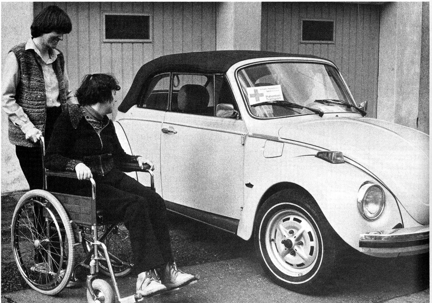
Die Rotkreuz-Autofahrer transportieren zwar die Patienten gratis und erhalten, auf Wunsch, nur eine Kilometerentschädigung, aber die Organisation für diese Dienstleistung und die Versicherung kosten doch Geld.