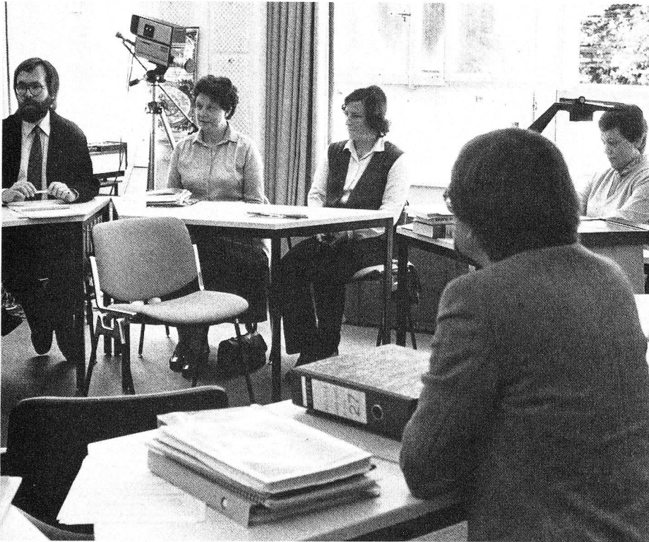
1983 fanden insgesamt 1253 Kurse für Gesundheits- und Krankenpflege statt (unten: «Pflege von Mutter und Kind»). Die Instruktion der Kurslehrerinnen (links), ihre Entschädigung, die ganze Organisation, das Material erfordern beträchtliche Aufwendungen.