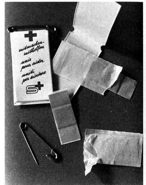
Das Abzeichen: Pflasterli und Sicherheitsnadel.

Wer aber keine Zeit oder kein Talent für solche praktische Tätigkeit hat, dem steht eben die Möglichkeit offen, mit einem finanziellen Beitrag «dabei» zu sein. Wir danken allen jetzt schon, die unserer Maisammlung ihren kleinen oder grossen Obolus zukommen lassen werden.