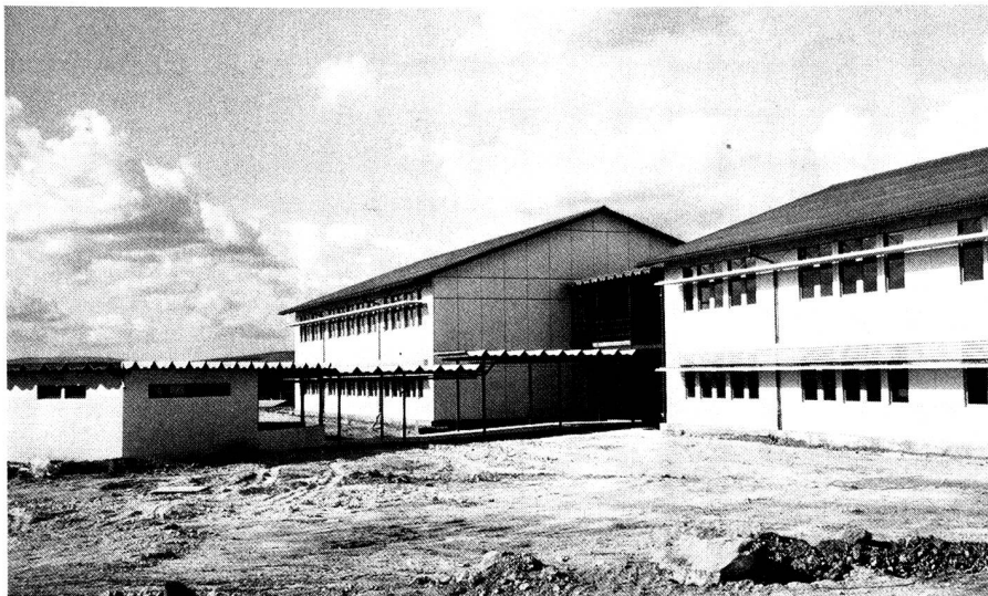
Das mit Schweizer Hilfe erbaute Lyzeum für 1000 Mittelschüler von El Asnam ist weitgehend erdbebensicher ausgeführt; es enthält 25 Unterrichtsräume. Dazu gehören ein Verwaltungs- und Diensttrakt und zwei Wohnhäuser.

Die Behörden und die Institutionen, die im Provinzhauptort wirkten, haben nach und nach die Zügel wieder in die Hand genommen, die Bedürfnisse und Prioritäten festgelegt, die Koordination der Hilfsmassnahmen übernommen. Verhandlungen mussten angebahnt, geologische Untersuchungen durchgeführt, Pläne erstellt werden. Der langen Liste notwendiger Arbeiten auf der einen Seite standen die Möglichkeiten der zur Unterstützung bereiten Staaten gegenüber. Damit war auch der Zeitpunkt gekommen, da sich die verschiedenen Geldgeber untereinander verständigen mussten. Wer macht was mit wem?