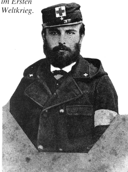
Sanitätssoldat im Ersten Weltkrieg.

Übung eines MSV: Vorbereitung zu Oberschenkelfixation.