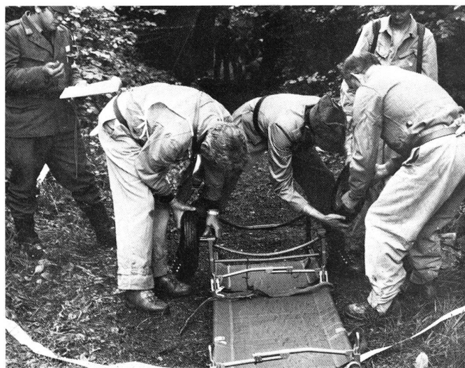
Modernes Rollgestell mit Tragbahre.

Übung eines MSV: Vorbereitung zu Oberschenkelfixation.