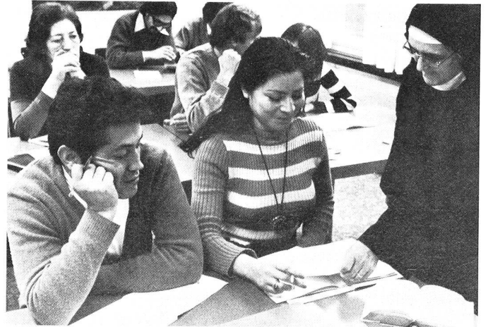
. . . einige haben von der Schweiz Asyl erhalten.