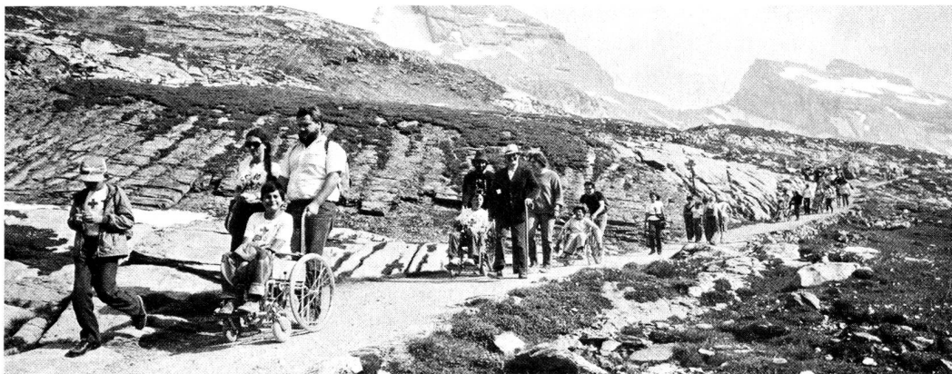
Der «Tatzelwurm», der Zug von 15 Rollstuhlfahrern, Begleitern und Begleitgepäckwagen auf dem Weg von der Gemmi nach Schwarzenbach. Dieser ungewöhnliche Ausflug war für alle ein grosses Erlebnis.