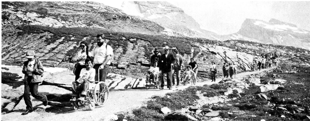
Der «Tatzelwurm», der Zug von 15 Rollstuhlfahrern, Begleitern und Begleitgepäckwagen auf dem Weg von der Gemmi nach Schwarenbach. Dieser ungewöhnliche Ausflug war für alle ein grosses Erlebnis.