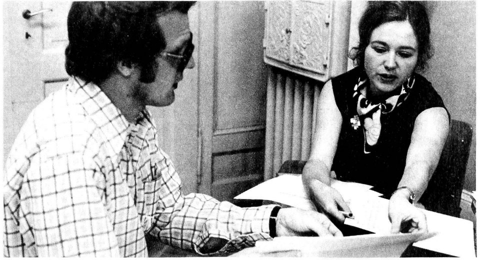
Lernen zu zweit, wertvoller Erfahrungsaustausch

Pflegedienste in den Spitälern, wo es um des geordneten Funktionierens willen nötig war, sich vordringlich mit Organisationsfragen zu befassen, folgte eine Periode der Wiederbesinnung auf die menschliche Ausrichtung der Pflege. Das Konzept der umfassenden, individuellen Pflege, das der Gruppenpflege zugrunde liegt, ist viel anspruchsvoller als das der technischen Pflege. Patientenorientierte Pflege verlangt eine Auseinandersetzung mit den Bedürfnissen von gesunden, kranken, genesenden und sterbenden Menschen und die Fähigkeit des einführenden Gesprächs. Die Erkenntnis, dass sich in der Pflege immer ein zwischenmenschlicher Beziehungsprozess abspielt, dass also das Verhalten der Schwester das Verhalten des Patienten beeinflusst und umgekehrt, bedingt auch eine Auseinandersetzung der Pflegeperson mit sich selbst, mit ihren eigenen Bedürfnissen, Gefühlen und Reaktionen. Patientenorientierte Pflege ist ein Problemlösungsprozess.