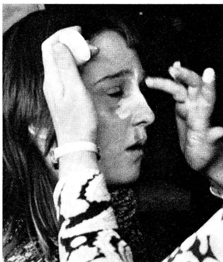
Dem Opfer wird der Schädelbruch aufgeschminkt.

Die Materialzentrale des Schweizerischen Roten Kreuzes ist zum Ort des friedlichen Wettstreites ausgewählt worden. In den grossen Lagerräumen, wo Kursmaterial für die Laienkrankenpflege, Altkleider und eine vielfältige Auswahl an Hilfsgütern auf den Versand warten, hört man Gemurmel und Lachen. Die Posten, bei denen die Jugendlichen zeigen müssen, was sie gelernt haben, sind auf drei Stockwerke verteilt. Zwölf Samariterlehrer und -lehrerinnen vom Samariterlehrerverband Bern-Mittelland amten als Experten. Schüler der Primar- und Se-