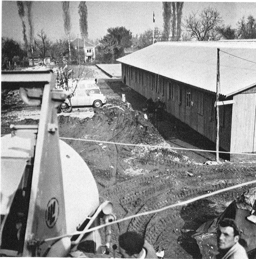
Unsere Aufnahmen entstanden im November des vergangenen Jahres, als an den Schweizer Holzhäusern noch fleissig gearbeitet wurde. Sie können daher nur einen vorläufigen Einblick in unsere Hilfsaktion zugunsten der Erdbebengeschädigten von Skoplje geben.