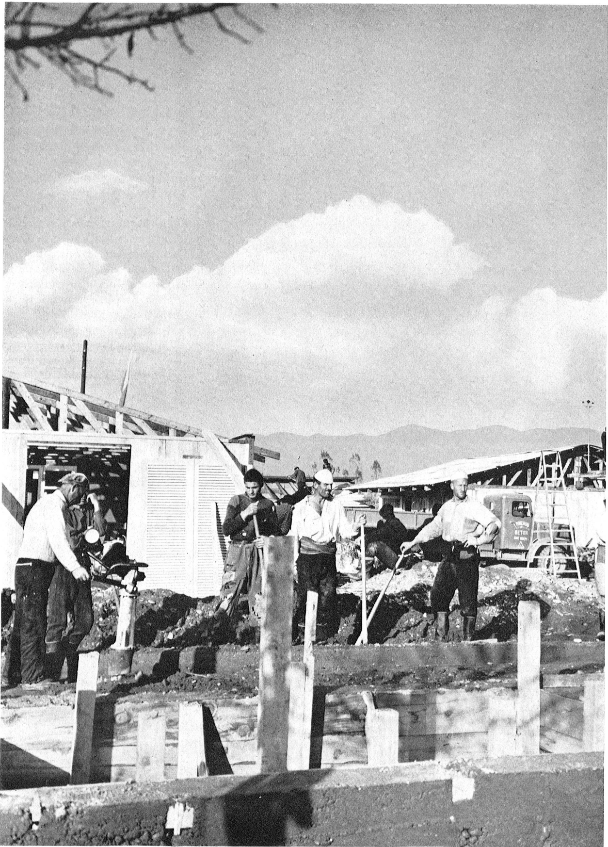
Am Rande der Stadt Skoplje ist ein riesiger Bauplatz entstanden, auf dem bis nach Einbruch der Dunkelheit unermüdlich gearbeitet wird. Der Boden muss ausgeschachtet, Fundamente müssen errichtet, Kanalisation und Leitungen müssen gelegt werden. Menschen aller Länder und aller politischen Richtungen haben sich in Einmütigkeit zusammengefunden, um an der grossen Hilfsaktion in Skoplje mitzuarbeiten.