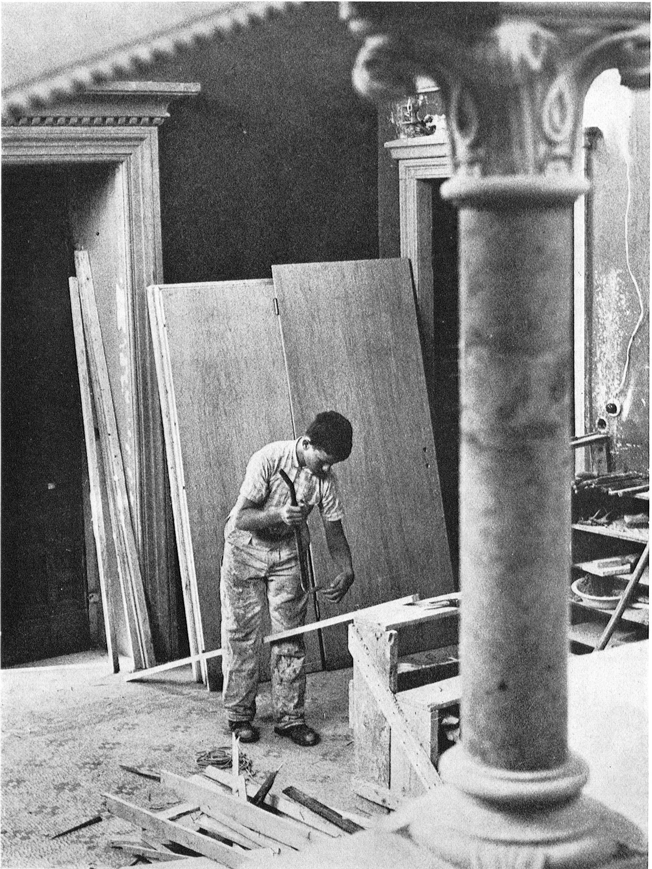
Unter der geschickten Hand eines Schreinerlehrlings, der, wie alle übrigen freiwilligen Arbeiter, seine Ferien opferte, um bei den dringend notwendigen Renovationsarbeiten in der «Casa Henry Dunant» mitzuhelfen, bekommen die stark beschädigten Türen ihren letzten Schliff.