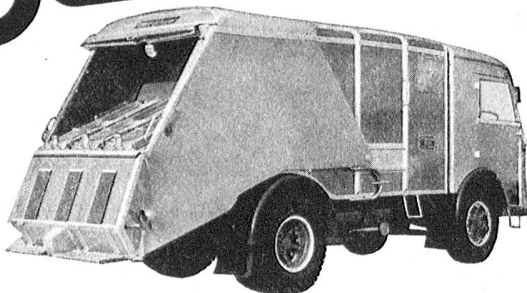
J. OCHSNER & CIE. AG ZÜRICH 1, Bahnhofstrasse 57a, Tel. (051) 27 00 77

* deshalb Kehrichtabfuhr nach System Ochsner