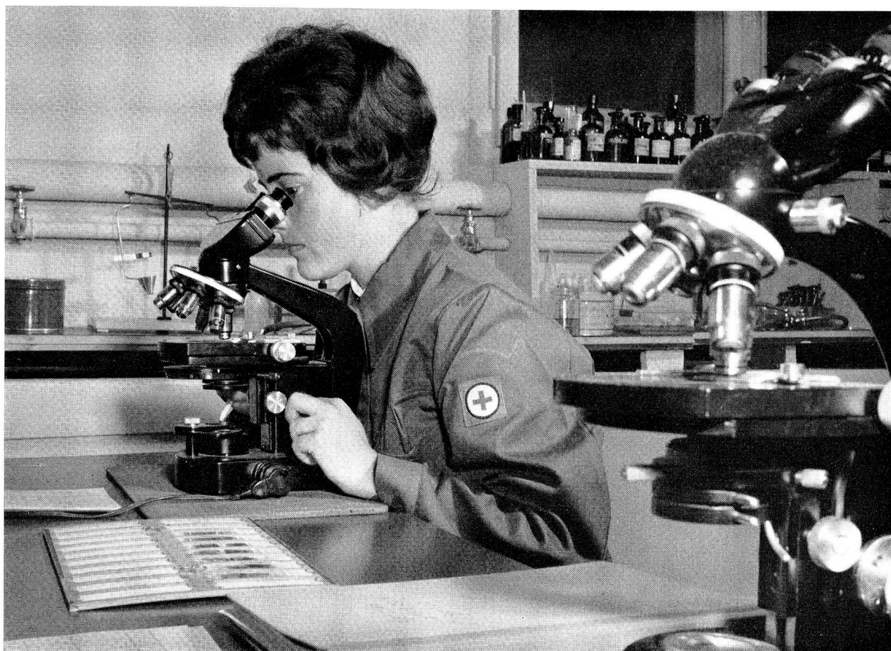
Zur Betreuung der Laboratorien in den Militärspitälern bedarf der Rotkreuzdienst fachlich geschulter medizinischer Laborantinnen, die den Rotkreuzdetachementen zugeteilt werden. Bild unten: Die Hilfspflegerinnen des Rotkreuzdienstes sind die rechte Hand der Krankenschwestern. Sie versuchen sie so viel als möglich zu entlasten.