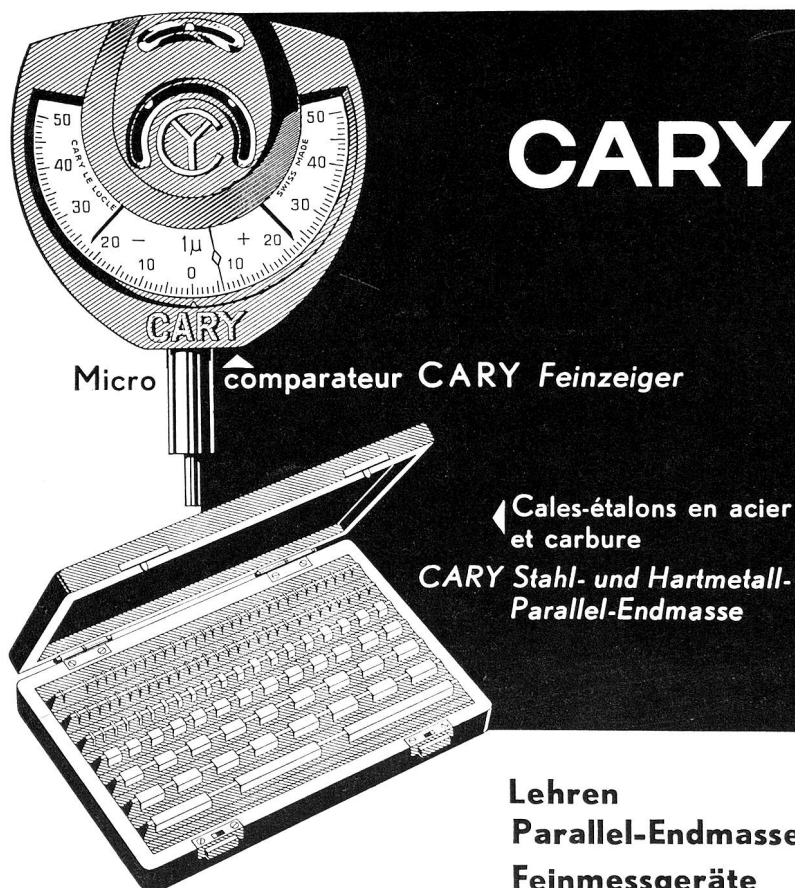
Micro comparateur CARY Feinzeiger

Weil sie mit ihren weltweiten Beziehungen und ihren erfahrenen, wohlinformierten Fachleuten für die Beratung in allen Geldsachen vorzüglich eingerichtet ist. In jedem Betrieb, ob klein oder gross, stellen sich Probleme, die mit Vorteil in Zusammenarbeit mit unserer Bank gelöst werden. Oft sind Zahlungen dann zu leisten, wenn die Barmittel knapp sind. Oder es sollte rasch eine Auskunft zur Hand sein über einen neuen Kunden, über die zweckmässige Abwicklung von Auslandsgeschäften, die Lage an den Waren- und Effektenmärkten und dergleichen. Die Gelegenheiten, bei denen wir unseren Kunden mit Rat und Tat behilflich sein können, sind zahlreich.