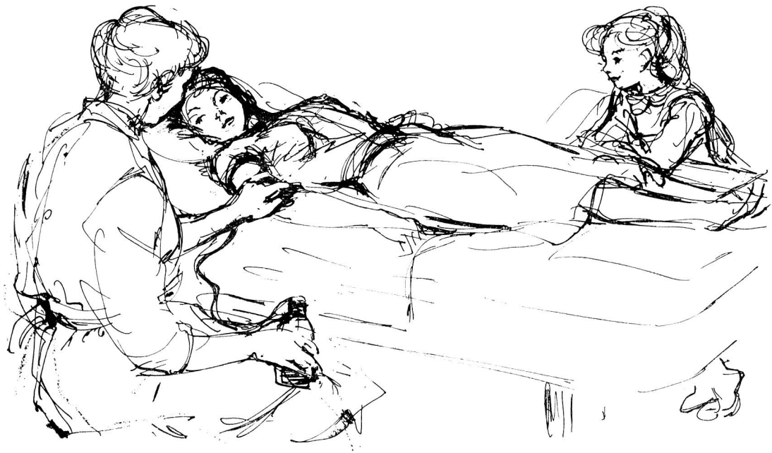
Zeichnung von Margarete Lipps, Zürich

eins, der alle Vorbereitungen getroffen und die Spender aufgeboten hat, Blutentnahmen vorzunehmen, damit die Reserve im Frigidaire aufgefüllt und die eigenen Spender etwas geschont werden können. «Dann kann man abends stolz den gefüllten Frigidaire betrachten und meinen, dieses Blut werde einige Tage reichen, und wenn man anderntags