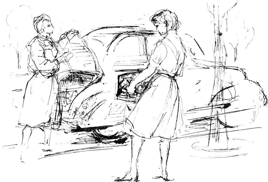
Zeichnung von Margarete Lipps, Zürich

jeden Monat rund 1500 Blutspender von ihrem Blute spenden müssen. Zurzeit stehen dem Zentrum Bern 10 000 Spender zur Verfügung, was indessen bei der steigenden Nachfrage noch nicht genügt. Vergessen wir nicht, dass die Reserve im Frigidaire, die ständig sofort ersetzt werden muss, alle Blutgruppen sowie auch Blut mit komplizierten Unter-