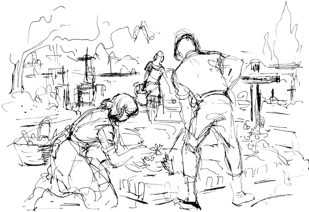
Kinder des Jugendrotkreuzes pflegen in verschiedenen Ländern, darunter auch in der Schweiz, vergessene Gräber. Zeichnung von Margarete Lipps, Zürich

sehen wecken und sie auffordern kann, darüber nachzudenken, ob nicht auch sie schon mithelfen könnten, Not zu lindern. Voller Eifer werden die Kinder Vorschläge bringen; diese dürfen bereits als Beweis ihrer Hilfsbereitschaft gewertet werden, so dass der Lehrer nur noch beratend helfen muss, die Vorschläge in die Tat umzusetzen.