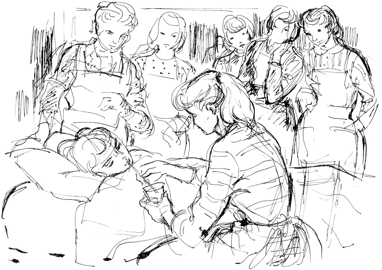
Die Jugendrotkreuzklasse in St. Georgen folgt interessiert einem Kurs für häusliche Krankenpflege.