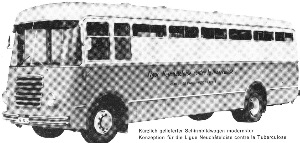
Kürzlich gelieferter Schirmbildwagen modernster Konzeption für die Ligue Neuchâteloise contre la Tuberculose

aller Leistungsklassen, vom einfachsten, portablen Apparat bis zum leistungsfähigsten Sechsventil-apparat, für ortsfeste Anlagen oder Röntgencamions.