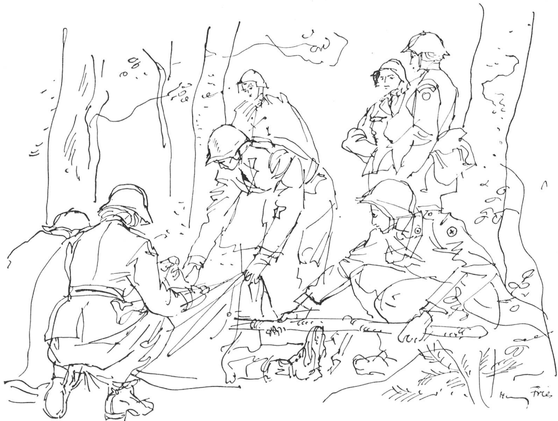
Verwundetentransport mittels eines starken Astes und einer Zelteinheit. Zeichnung von Hanny Fries, Zürich.

Nur kurze Zeit blieb, in die Kaserne zurückgekehrt, zum Retablieren. Denn um 15 Uhr begann die Feier zur Einsetzung in die neue Funktion im Rittersaal des Schlosses Valangin. Im Bewusstsein um die Bedeutung ihrer neuen Verantwortung trat eine jede vor den Rotkreuzchefarzt. Mit einem Handschlag bekräftigten Samariterinnen und Pfadfinderinnen vor dem weissen und roten Kreuz ihre Bereitschaft, sich im Notfalle dem Roten Kreuz und damit der leidenden Menschheit zur Verfügung zu stellen. Stolz nahm jede ihre Jacke mit dem schmalen grauen Streifen entgegen, diesem verpflichtenden Symbol des Vorgesetzten-Seins. Als Gruppenführerinnen verliessen sie Schloss Valangin.