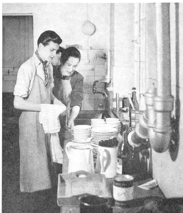
Wechselnde Gruppen halfen jeweils im grossen Haushalt.