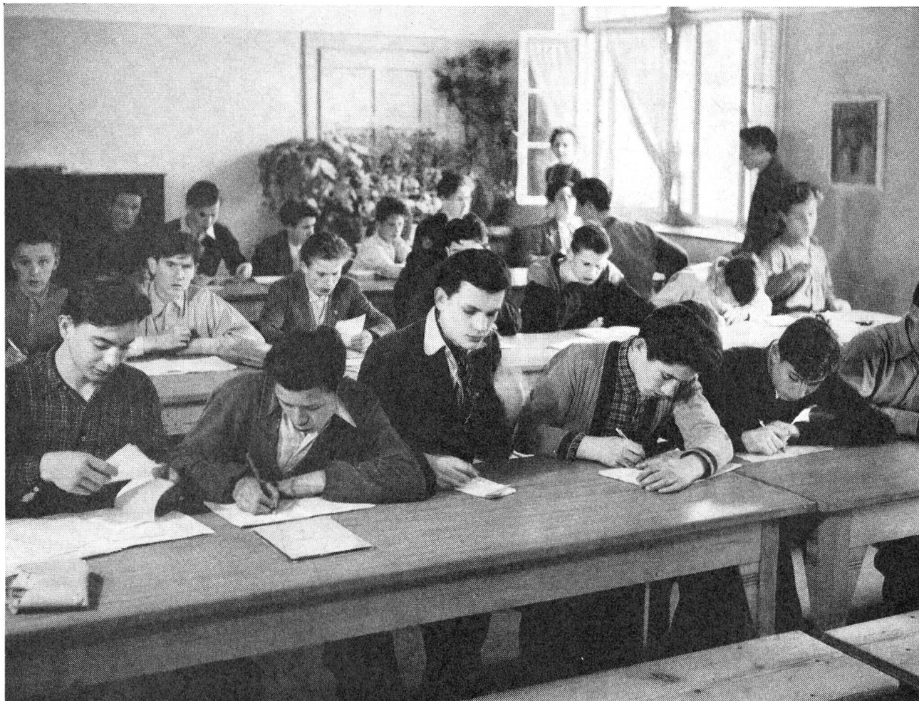
Im schönen Thuner Ferienheim «Bühl» ob Walkringen hatte das Schweizerische Rote Kreuz bis zum 20. März einen Teil der von ihm betreuten ungarischen Jugendlichen bis zur Eingliederung untergebracht. Im grossen Esszimmer wurde auch der tägliche Deutschunterricht erteilt.